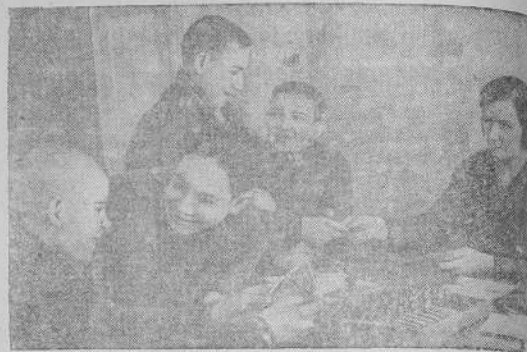
Ученики школы получают заработок.

В школе ФЗО № 1 при тресте «Строитель» (Москва).